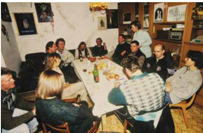
Ustanovni člani Društva ljubiteljev Križne jame | Foto: arhiv društva

Leta 1988 je bilo v jami prvič nad tisoč obiskovalcev. Domačini so takrat že nudili opremo za ogled vodnega dela (čolne, škornje, čelade, obleke). Društvo so konec leta 1997 ustanovili domačini z Bloške Police, Bločic in okoliških krajev in ga januarja 1998 tudi registrirali. Že od ustanovitve