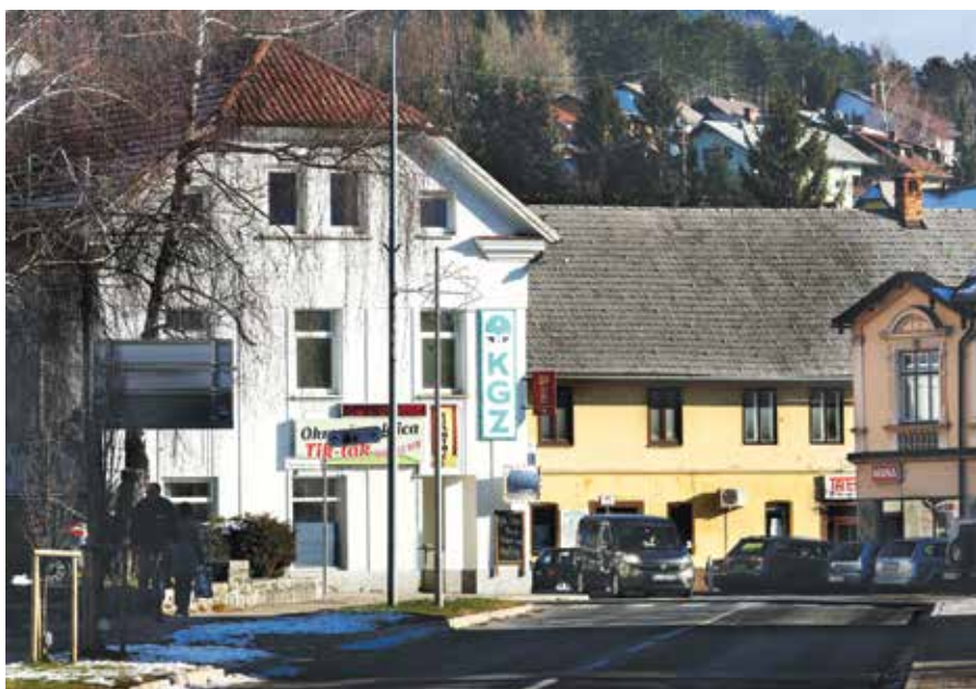
Trgovina v središču Cerknice sameva

Naši sogovorniki so mnenja, da je zaprtje trgovine v Begunjah katastrofa. Veliko vasi je tako ostalo brez možnosti nakupa najosnovnejših življenjskih potrebščin, ki se jih je v trgovini KGZ Krpan lahko kupilo po precej zmernih cenah. »Dokler so bile police še polne, smo lahko tudi v vaški trgovini opravili večje nakupe, tedenske. Tudi če česa ni bilo na zalogi, so trgovke uredile, da so dostavili v trgovino, in tako domačinom ni bilo treba v Cerknico ali še kam dlje,«