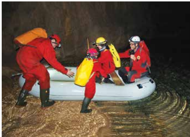
Vkrčavanje v čoln