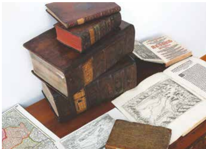
Knjižnica hrani kar 100 enot gradiva, ki je nastalo pred letom 1800.

Zbirka vsebuje najrazličnejše zvrsti: knjige, časopise, rokopise, notno gradivo, kartografsko gradivo, slikovno, video, zvočne posnetke, drobni tisk (prospekti, plakati, vabila), gradiva društev, diplome, disertacije, raziskovalne naloge, brošure, kataloge ... Zbirka je v letu 2017 obsegala 7500 knjig, periodične publikacije, zemljevide, od tega 100 enot gradiva z nastankom pred letom 1800 (najstarejša knjiga O čudovitih ogrskih vodah je iz leta 1595),