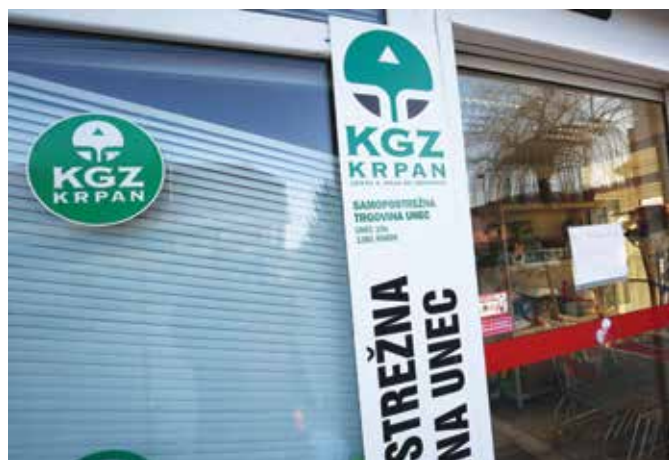
Zaprta trgovina na Uncu