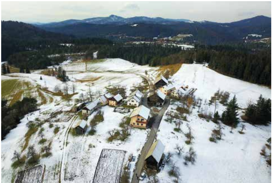
Vas na planoti

O kmetijski dejavnosti se razgovori Ludvik Štritof : »Pokosimo okrog 10 hektarjev. Seno prodam na senožeti;