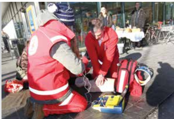
Avtorica: Maruša Opeka

V Hoferju načrtujejo, da bodo do januarja 2018 po slovenskih krajih namestili 23 avtomatskih eksternih defibrilatorjev, ki bodo dostopni vsem. Ugotavljajo namreč, da je po državi sicer že veliko avtomatskih defibrilatorjev, ki pa na žalost niso javno dostopni, če pa že so, so ponoči in ob vikendih zaklenjeni in takrat nedostopni za reševanje ob srčnem zastoju.