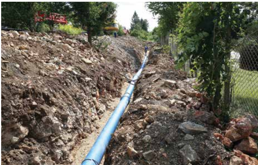
Občina je od leta 2010 za investicije v vodovode namenila 3,6 milijona evrov.

Glede na to, da so se amandmaji nanašali tudi na subvencioniranje malega gospodarstva in posameznikov, ki bi želeli bivati v manj naseljenih predelih občine, pa je Rupar jassen, da mora občina v prvi vrsti poskrbeti za ustrezno infrastrukturo in urejene prometne povezave. Prepričan je,