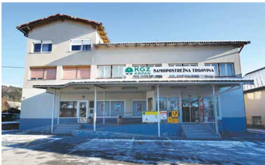
V Begunjah si želijo, da bi trgovina čim prej znova zaživela.

Del trgovine v Begunjah je bila tudi pošta, kar je bila posledica reorganizacije delovanja Pošte Slovenije. Pošta ostaja odprta zaradi pogodbe, vsak dan v tednu za dobri dve uri. Domačini lahko vsaj poravnajo položnice ali dvignejo gotovino – z zaprtjem trgovine v Begunjah je namreč