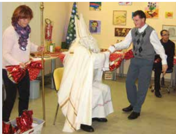
Avtorica: Mateja Curk

Ker pa smo bili vse leto tako pridni in marljivi, smo se skupaj z društvom Sožitje Cerknica razveselili posebnega obiska. K nam je prišel namreč sveti Miklavž, ki je opazil našo marljivost in nam prinesel darila.