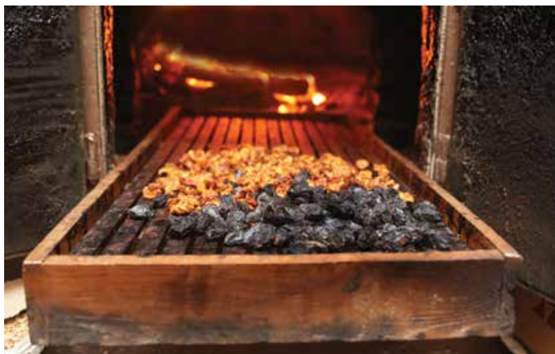
Lesi s posušenim sadjem v istju, v odprtini pred kuriščem krušne peči

Slugovo je danes vas mladih ljudi. Posebej je vas zaživela, ko so prišle tri ta mlade . Fantje so jih pripeljali iz Loškega Potoka in Ribnice. Kljub