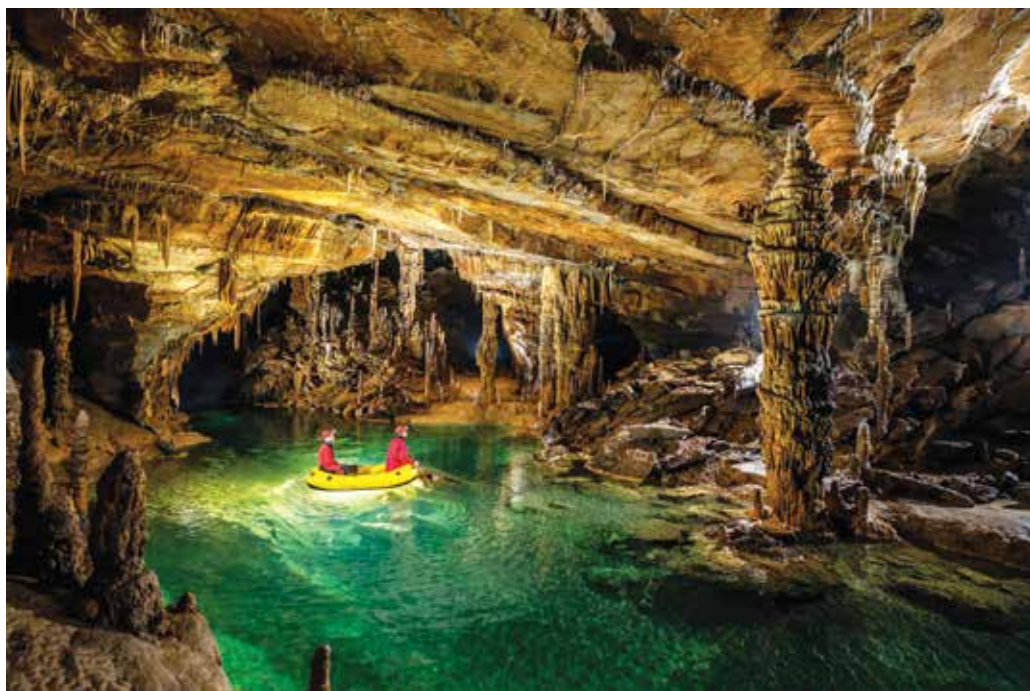
Dvorana Kalvarija v Križni jami

Si pa pri reševanju osnovnih infrastrukturnih zadev v prihodnje želimo več sodelovanja z občino, državo in Notranjskim regijskim parkom. Nujno sta potrebni razširitev ceste od glavne ceste do jame in postavitve izboljšane signalizacije na cestnih odsekih. Tudi v prihodnje se bomo trudili, da bi našim zanamcem zapustili kar najbolj ohranjeno Križno jamo.