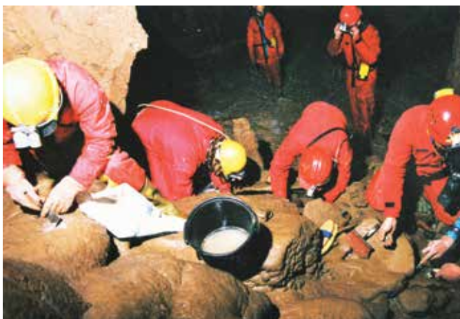
Čiščenje odpadnega karbida v Križni jami

prireditev po celi Sloveniji in tujini. Med raziskovalnimi dejavnostmi velja izpostaviti odkritje Nove Križne jame in jame Obrh Čolnici. Poleg same Križne jame redno skrbimo tudi za gozdno učno pot okoli jame, signalizacijo na Križno goro, objekt pred jamo, vhodni del jame, urejeno dostopno pot in za ostala opravila, ki so potrebna, da obiskovalci lahko nemoteno obišejo Križno jamo. Tekom leta so v društvu tri osebe redno zaposlene. Stroške zaposlitev v celoti financiramo iz sredstev društva. V času poletne sezone, ko je obiskovalcev največ, pa posredno ali neposredno v društvu deluje okoli deset sodelavcev. Takrat pred Križno jamo deluje tudi informacijska točka, kjer je dnevno prisoten informator. Zgledno urejena sta tudi internetna stran in Facebook profil.