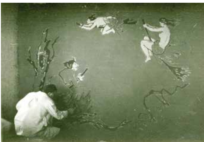
Perko, ki ustvarja zgrafite.

Dom je med drugimi obiskala 22-članska ameriška delegacija strokovnjakov, ki jo je zanimala morebitna zažitev Cerkniškega jezera, in tudi člani generalštaba jugoslovanske armade, ki so leta 1974 spremljali jesenske vojaške vaje. Občudovali so širen razgled, verjetno še s kakšnega drugega zornega kota, kot je le planinski.