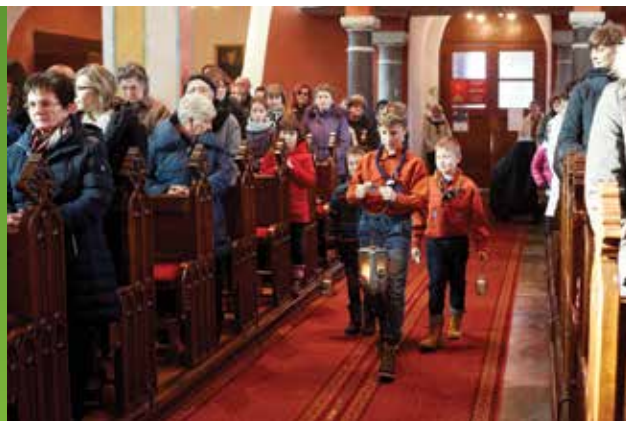
Avtorica: Tina Opeka

Luč miru iz Betlehema, ki simbolizira mir, povezovanje in enotnost, pa ni ostala le znotraj župnije. Ponesli smo jo tudi predstavnikom občine in drugim pomembnejšim ustanovam. Res si želimo, da bi njeno sporočilo doseglo čim več ljudi ter da bi ta mali plamen vsak sprejel z veseljem. Tako lahko zasvetimo skupaj in v novem letu v medsebojni povezanosti naredimo kaj dobrega tudi za druge.